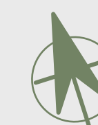
רחוב שאול חרנם